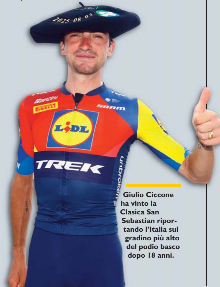
Giulio Ciccone ha vinto la Clasica San Sebastian riportando l'Italia sul gradino più alto del podio basco dopo 18 anni.