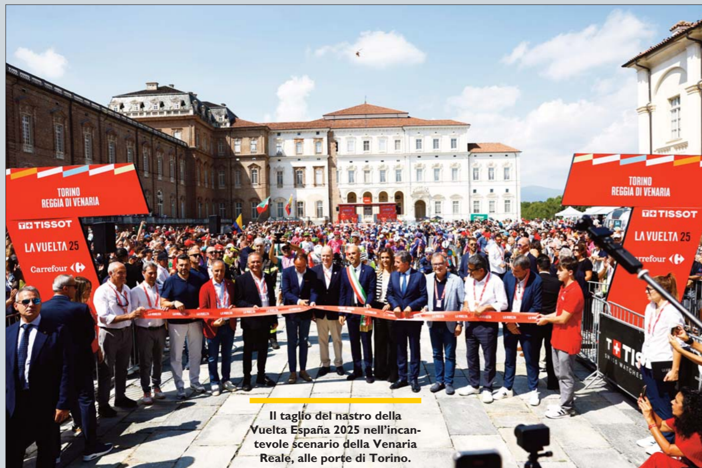
Il taglio del nastro della Vuelta España 2025 nell'incantevole scenario della Venaria Reale, alle porte di Torino.

«Io e il resto del consiglio di ACCPI facciamo il tifo per la Squadra, con la S maiuscola come l'ha ribattezzata il grande Alfredo Martini - conclude Salvato, da juniores e dilettante campione del mondo della cronometro a squadre nel 1989, 1993 e 1994, poi professionista dal 1995 al 2001. - Nella mia modesta carriera ho avuto l'onore di vestire in più occasioni la maglia azzurra e so quanto è speciale rappresentare il proprio Paese nell'apuntamento più importante dell'anno. Buona corsa a tutte e tutti. Forza azzurri!».